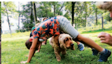
Rund um den Hund

Schon bald wird in den Schulen wieder das Ferienpass-Heftli verteilt. Das Wettrennen um die ersten Plätze ist ab sofort allerdings vorbei. Neu laufen die Anmeldungen und die gesamte Administration über das Feriennet, der Buchungsplattform der Stiftung Pro Juventute. Und damit ergibt sich ein neuer Ablauf für die Ferienpass-Buchungen: Während einer Wunschphase können verschiedene Angebote gewünscht werden. Ein automatischer Zuteilungslauf vergibt die Plätze. Nach diesem Zuteilungslauf ist im Benutzerkonto ersichtlich, welche Wünsche sich erfüllt haben. Anschliessend wird die Restplatzbörse eröffnet, in der noch direkte Reservationen nach dem Motto „der Schnäller isch der Gschwinder“ gebucht werden können. Nachdem auch das Zeitfenster für die Restplatzbörse geschlossen ist, werden die Rechnungen erstellt und die Buchungsmöglichkeit ist damit definitiv abgeschlossen.