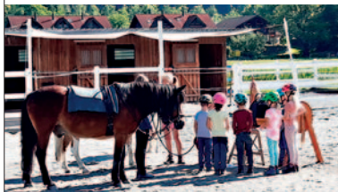
Rund ums Pferd

Das Wichtigste zuerst: Keine Eile, die Plätze werden nicht mehr nach Anmeldeeingang vergeben!