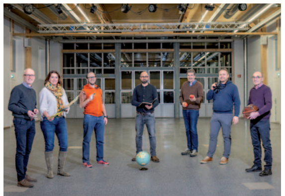
Der Gemeinderat geht voll motiviert in die neue Legislatur

Der Gemeinderat zeigt sich zufrieden mit dem Start in die neue Legislatur; die Stimmung ist gut, das teilweise neu zusammengesetzte Team langsam eingespielt und die Zuständigkeiten sowie die wichtigsten Aufgaben sind klar. Anspruchsvoll bleiben die angespannten, personellen Ressourcen - es sind noch nicht alle offenen Stellen besetzt - sowie unvorhergesehene Themen und Geschäfte, welche nach viel Flexibilität verlangen und Programme auch mal wieder über den Haufen werfen. Der Gemeinderat bleibt dran und nimmt Anregungen gerne auf.