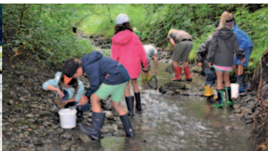
Aqua Viva Wassererlebnistag